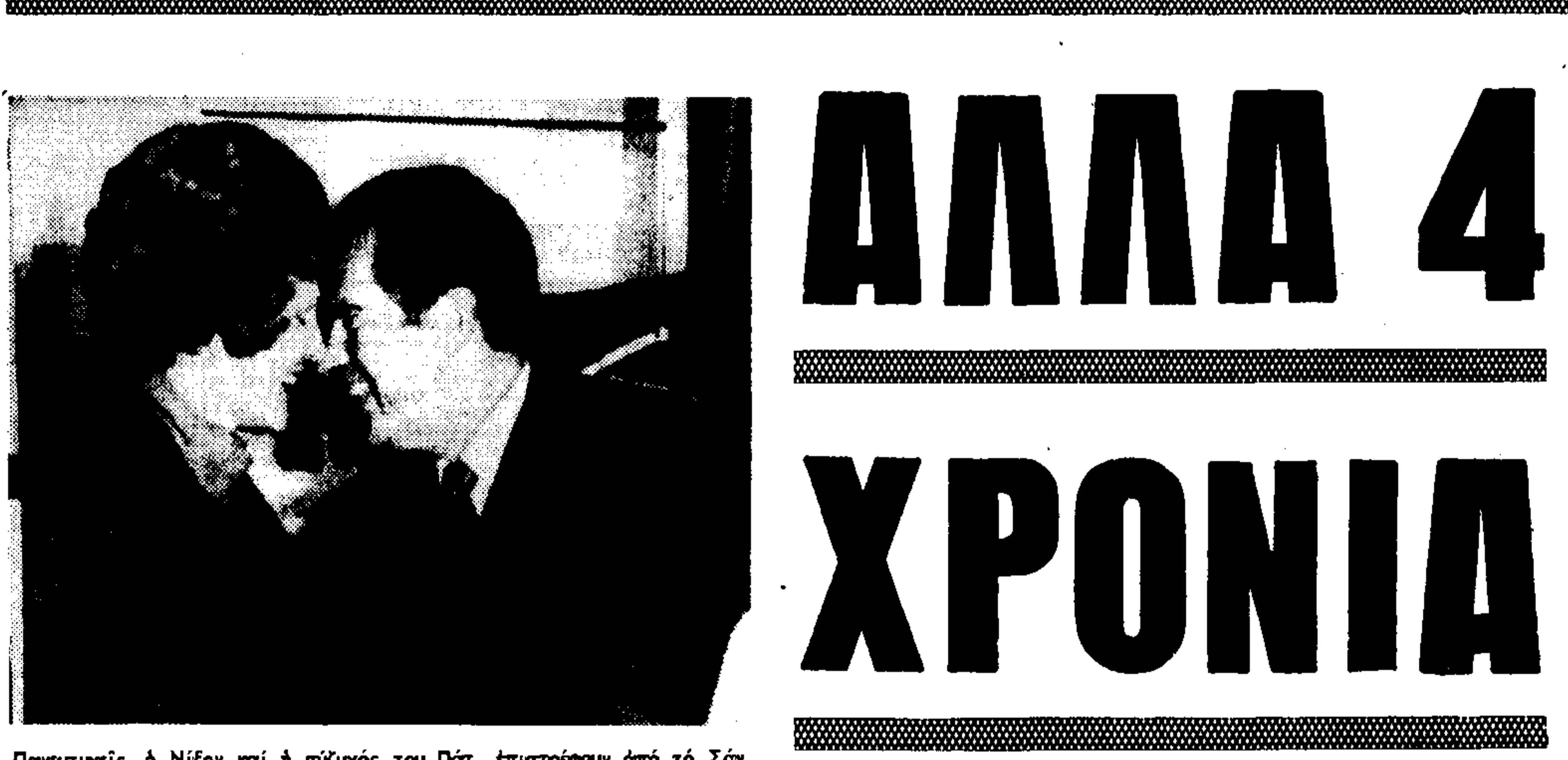
Παναγιώτης, ο Νίξον και η σύζυγός του Πάτ. Επιστρέφουν από το Σάν Κλωντ, όπου παρέλασαν κατά τις χθεσινές εκλογές. Ο πρόεδρος Νίξον παρακολούθησε την εξέλιξη των εκλογών από τον Λευκό Οίκο.